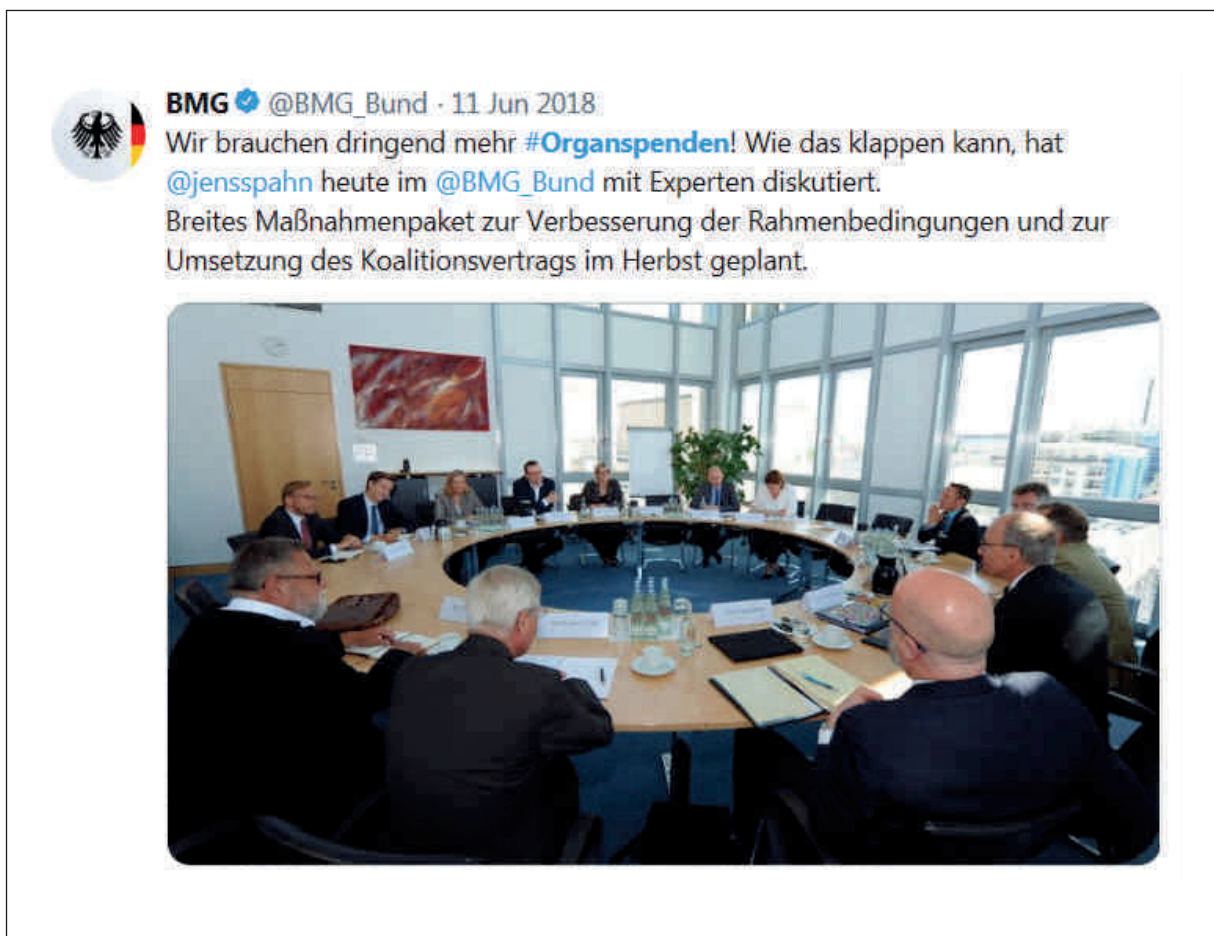
Tweet des Bundesministeriums für Gesundheit im Juni 2018 anlässlich erster Beratungen zur Umsetzung des Koalitionsvertrages