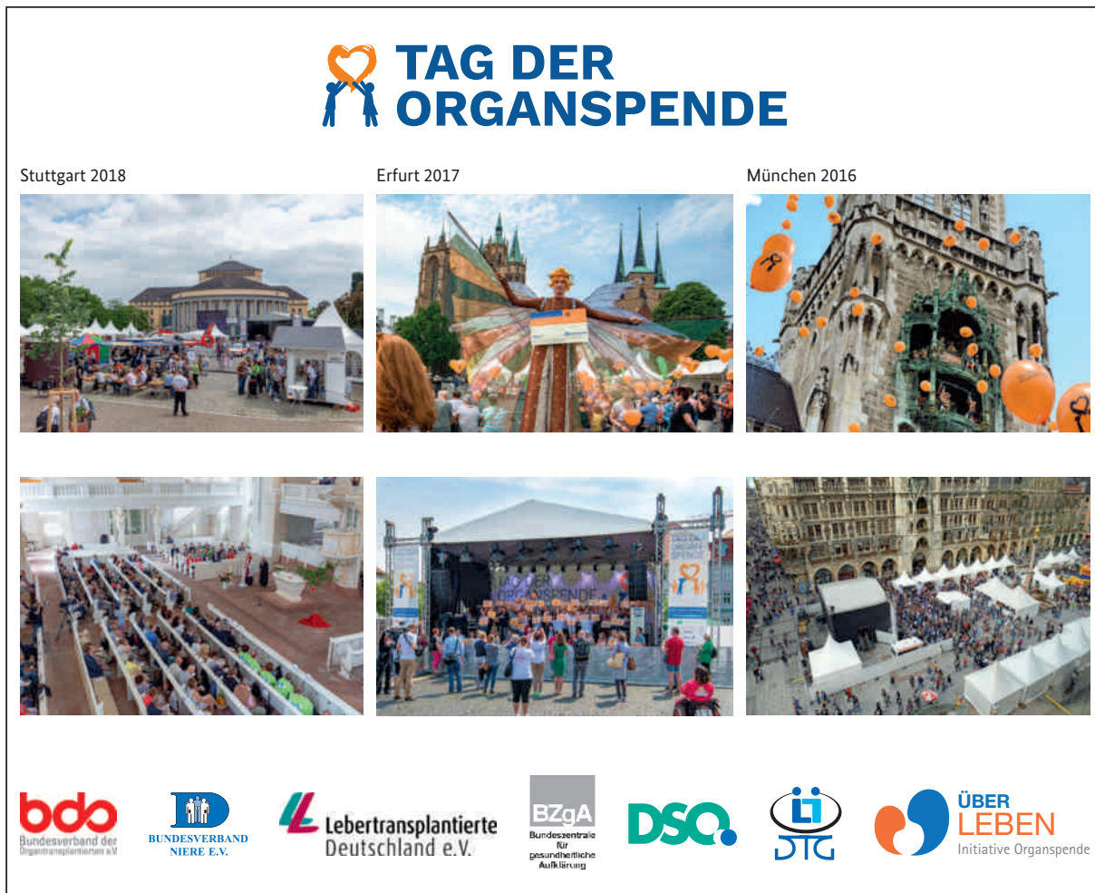
Zentrale Veranstaltung zum Tag der Organspende