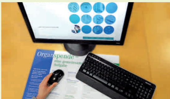
E-Learning der DSO unter elearning.dso.de

Die DSO bietet unter der Adresse https://elearning.dso.de ein Online-Weiterbildungsprogramm an, das sich sowohl an Transplantationsbeauftragte und interessierte Mitarbeiter in den Krankenhäusern, aber auch an die Mitarbeiterinnen und Mitarbeiter der DSO richtet. Das E-Learning-Programm bietet die Möglichkeit, spezifische Lerninhalte zu erarbeiten und auf diese Weise, Fachkenntnisse zum Ablauf einer Organspende zu erlangen, zu aktualisieren oder zu vertiefen. Es umfasst sowohl theoretische Grundlagen zur postmortalen Organspende als auch virtuelle, interaktive Organspendefälle. Das kostenlose E-Learning-Programm der DSO ist inhaltlich eng an das „Curriculum Transplantationsbeauftragter Arzt“ der BÄK angelehnt und wurde aus diesem Grund bereits von einigen Landesärztekammern in ihre jeweiligen Ausbildungsprogramme aufgenommen.